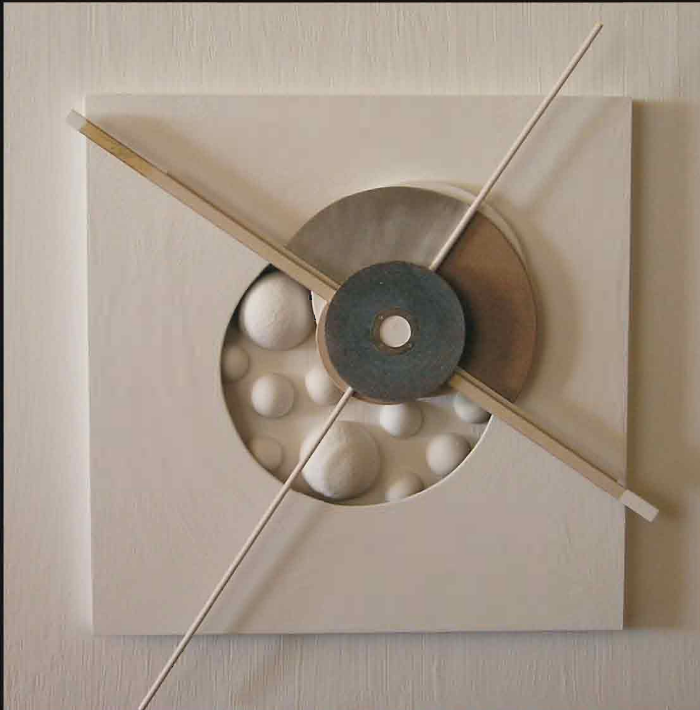
BIG BANG 4-10

Técnica mixta: acrílico, madera y metales.