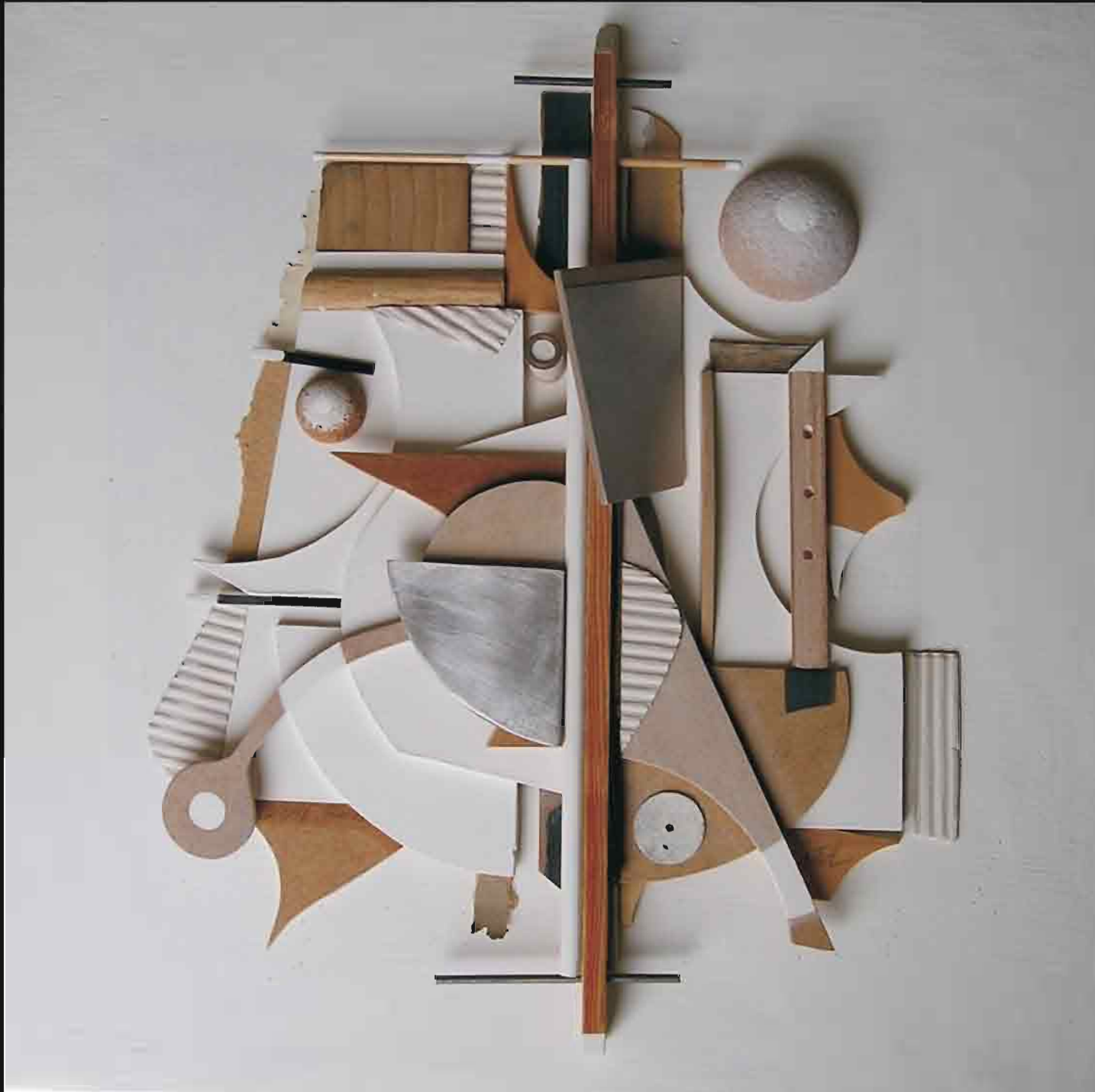
TOUR EIFFEL A CABALLO SOBRE EL SENA

Técnica mixta: acrílico, madera y metales.