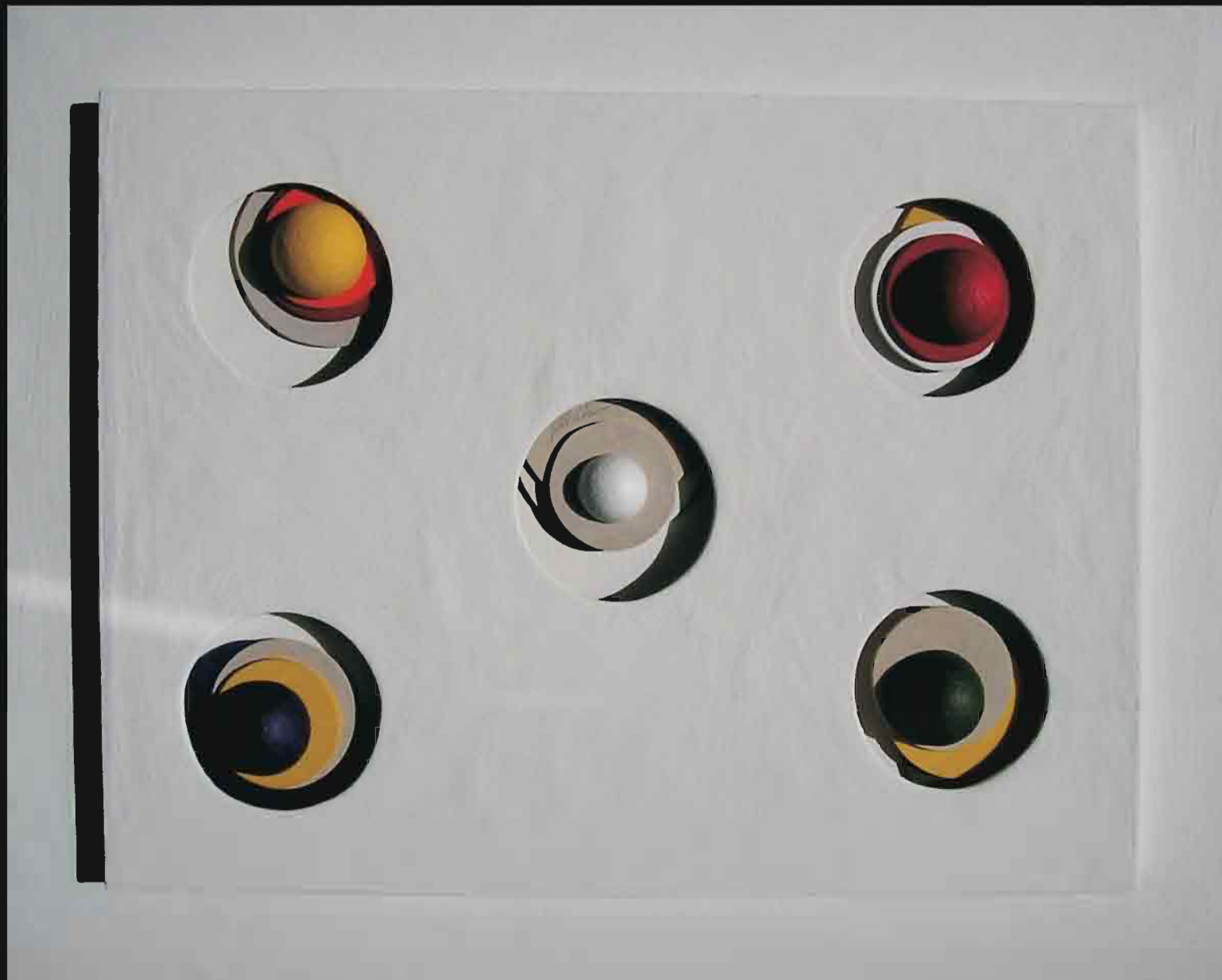
LAS CINCO LUCES

Técnica mixta: acrílico, madera y metales.