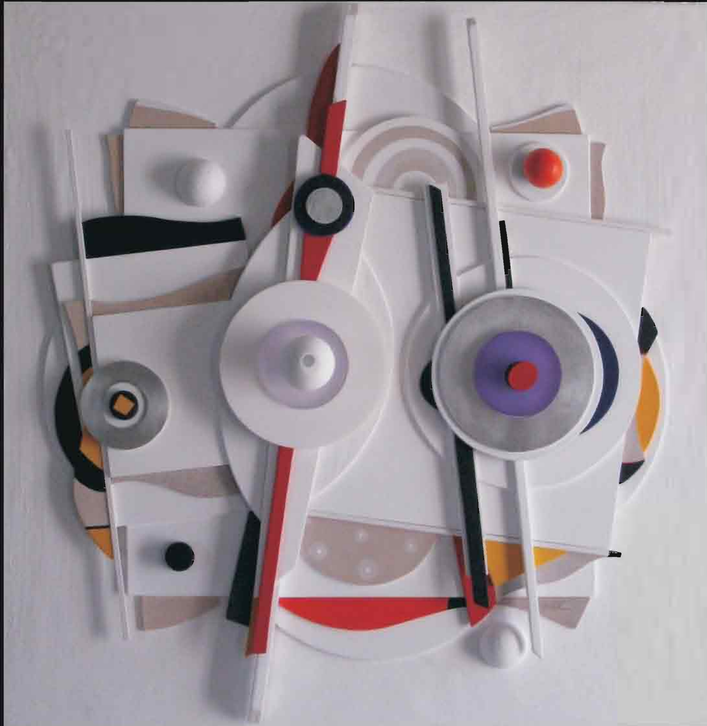
ARQUETIPO - MIRADA OBLÍCUA

Técnica mixta: acrílico, madera y metales.