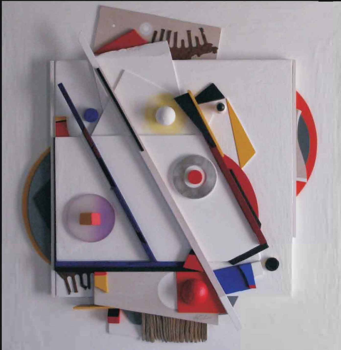
ARQUETIPO - MIRADA PARALELA (FLOTADOR)

Técnica mixta: acrílico, madera y metales.